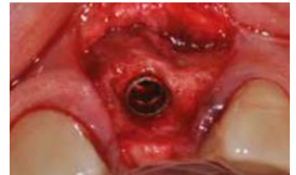
Implante insertado con un evidente defecto óseo horizontal.