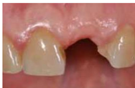
Tejidos blandos después de la curación completa.