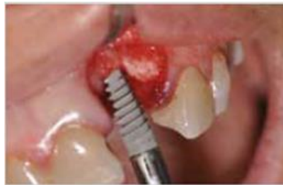
Preparación del lecho del implante con el uso de compactadores para expansión e inserción de un implante.