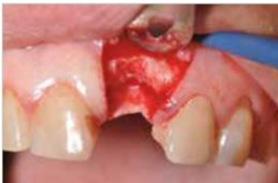
Apertura y desprendimiento de colgajo El defecto óseo vertical es evidente. El hueso es del tipo D3-D4.

Paciente con defecto óseo horizontal y vertical, que necesita un implante retardado rehabilitación. El lecho del implante se ha preparado con el uso de un manual. Uso de compactadores para evitar el daño de la pared ósea vestibular.